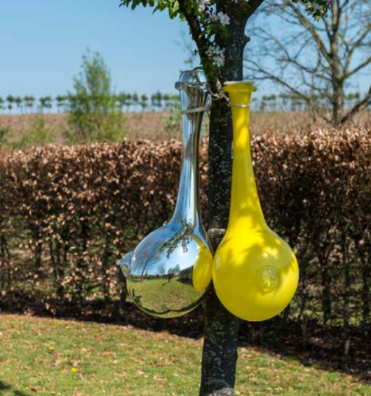
Maria Roosen: Breasts, 2019 (detail), Zwolle