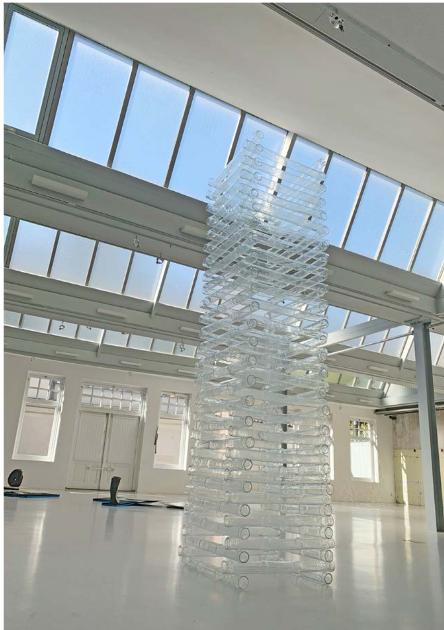
Jens Pfeifer: Elevated Nation, 2014, State of Transparency exhibition at Looiersgracht 60, 2019

JP: Generally I can say that I like art that appeals to me, stimulates me, and teaches me to think further. In particular I love to watch flowing glass, how it changes during the work process from one material state into another. But I also find the transparency of glass extremely fascinating. I think it is discussed way too little—although transparency is an issue that has been of interest in a sociocultural