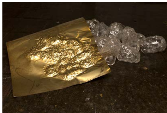
Mirre Yayla Seur: Meeting (For 41 Seconds), 2017, State of Transparency, exhibition at Looiersgracht 60, 2019, photo: Kateryna Snizhko, courtesy of Gerrit Rietveld Academie