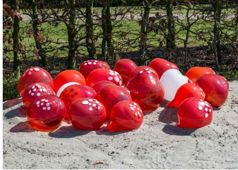
Ellen Vartun: Deadly Girl , 2013, Zwolle