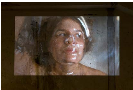
Laura Puska: Between Us, 2014/2019, State of Transparency exhibition at Looiersgracht 60, 2019