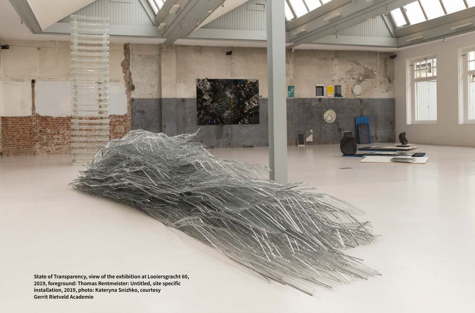
State of Transparency, view of the exhibition at Looiersgracht 60, 2019, foreground: Thomas Rentmeister: Untitled, site specific installation, 2019

NEUES GLAS: Trotz Ihrer Lehrtätigkeit verfolgen Sie auch weiterhin Ihren eigenen künstlerischen Weg. Ist das im Umgang mit Studierenden hilfreich?